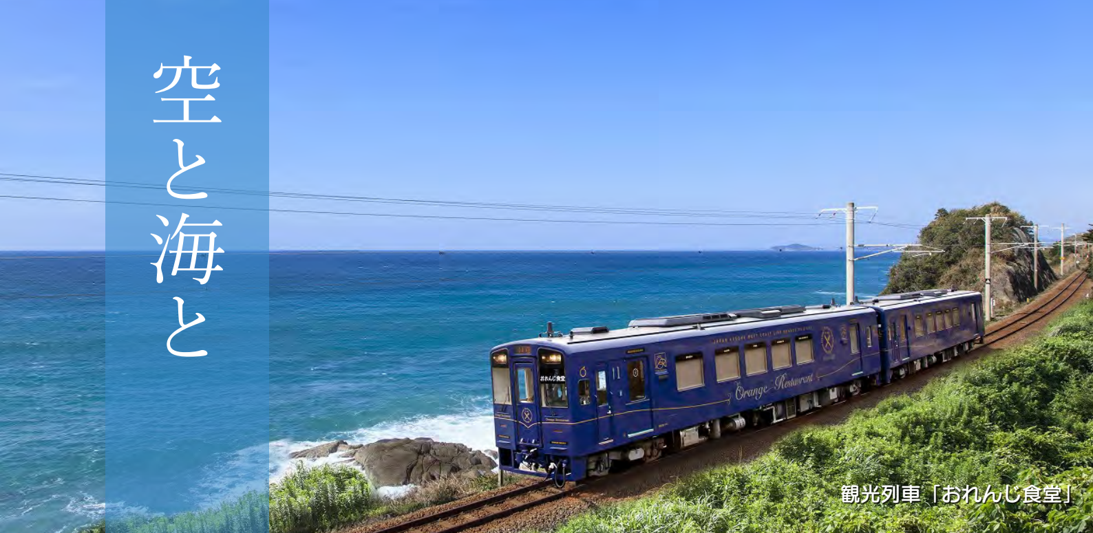
観光列車「おれんじ食堂」