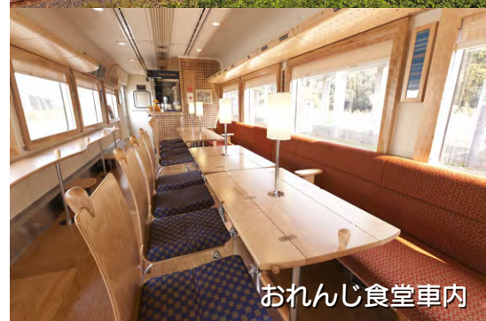
おれんじ食堂車内