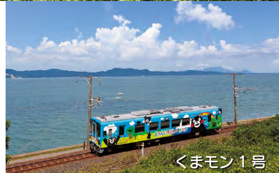
くまモン 1 号